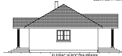
ELEVACJA BOCZNA PRAWA